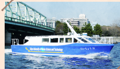
水素で動く燃料電池船 らいちようN

対象 小学4年生以上 ~ 大人 定員 35名 事前申込できます。詳しくは公式HPへ