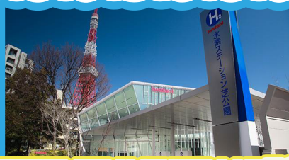
TOYOTA MIRAI SHOWROOM見学