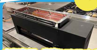
水素グリラー実演(トヨタ/リンナイ) 竹芝で水素グリラー・ランチ (お食事後自由解散)